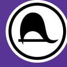
Illustration : CC-BY-2.0 Jim Bahn Publié sous la direction de : Nicolas Falempin et Nathalie Rosenberg, Parti Pirate France, 21 place de la République, 75003 Paris